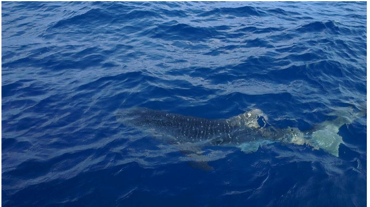
Walhai, seltener Begleiter bei einer Ausfahrt