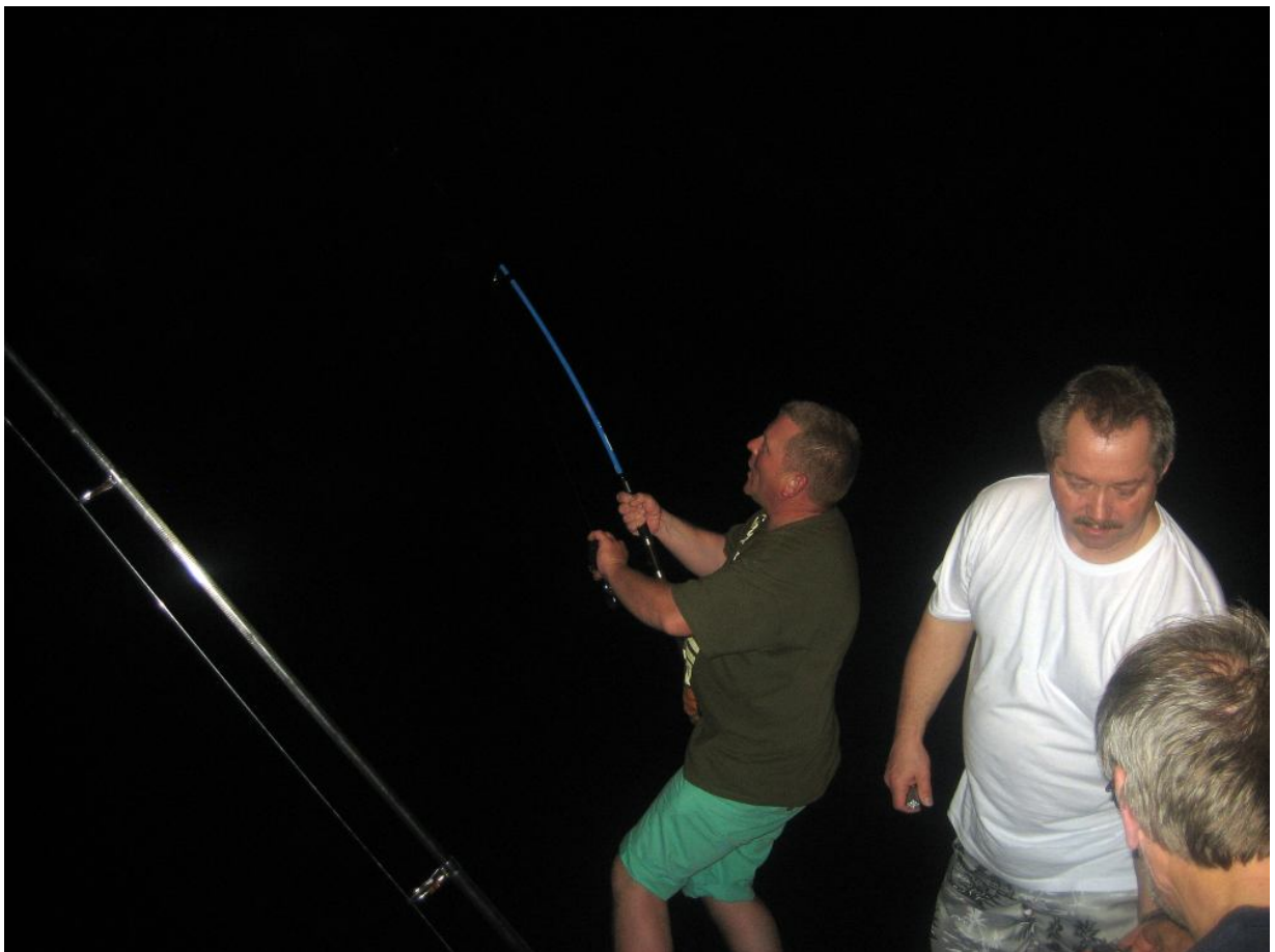
Angeln im Hafenbecken. Hier war ein Rochen mit gut 120cm Flügelspannweite im Drill Und wir wollten nur ein paar Snapper für den Grill haben..