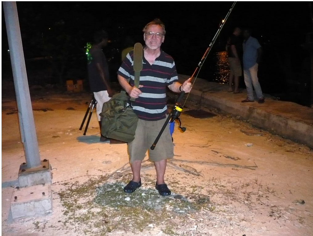
Zurück vom Nachtangeln. Die Sänger Aquantic hat einen ausgezeichneten Job gemacht