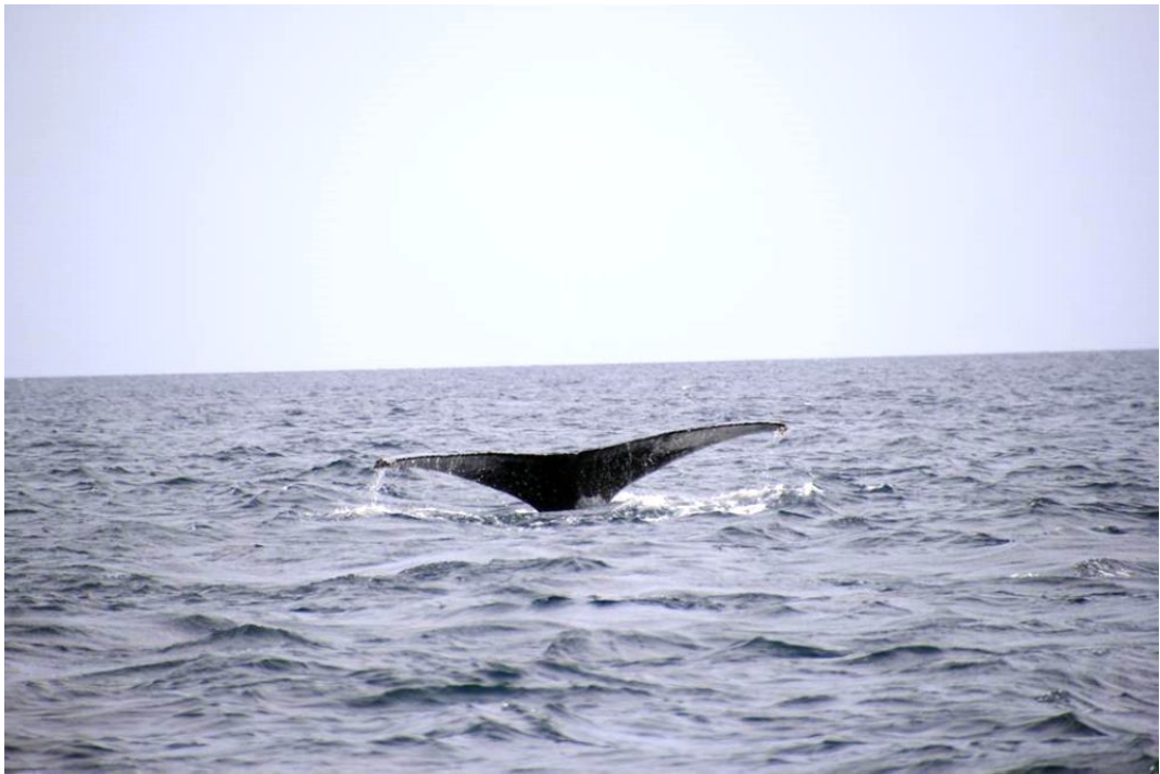
Der Wal tauchte knapp 50 m neben dem Schiff auf. Ein unglaubliches Erlebnis