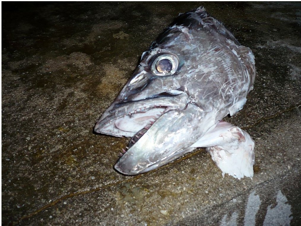
Dogtooth Tuna, der Hai war schneller, nur noch den Kopf übrig gelassen...