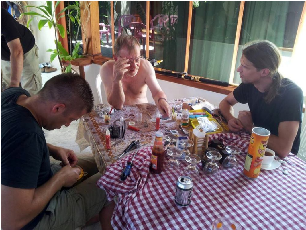
Rollenwartung unter Palmen