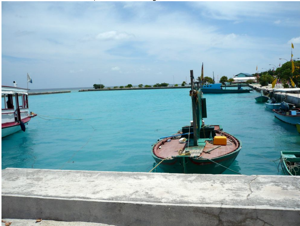
Hafen von Keyodhoo