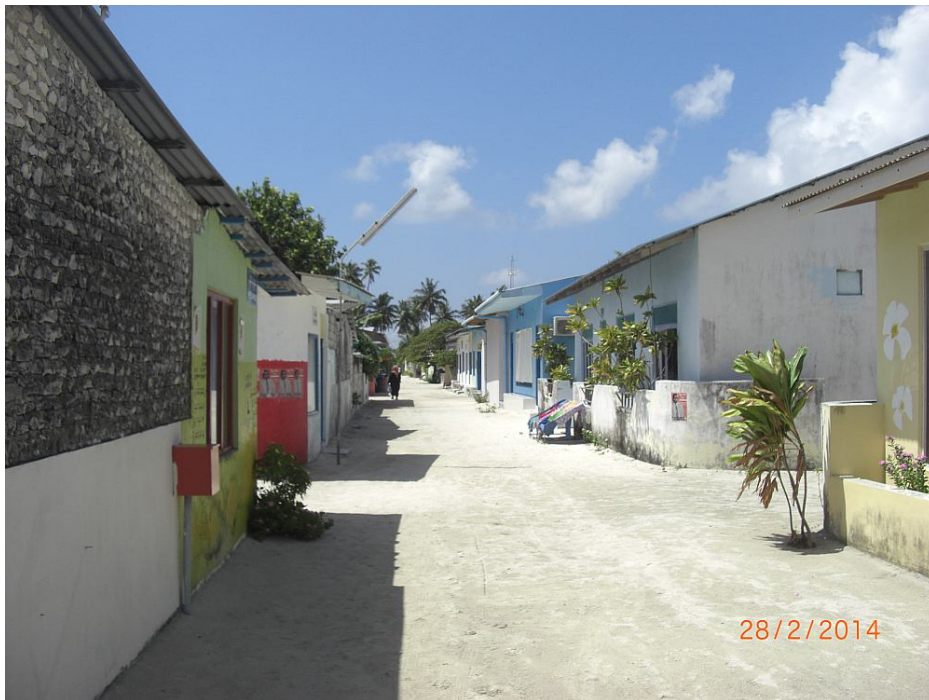
Eine natürlich gebliebene Insel. Nur ca. 250 Einwohner und erst seit Ende der 90er Jahre dürfen Ausländer die Insel betreten.