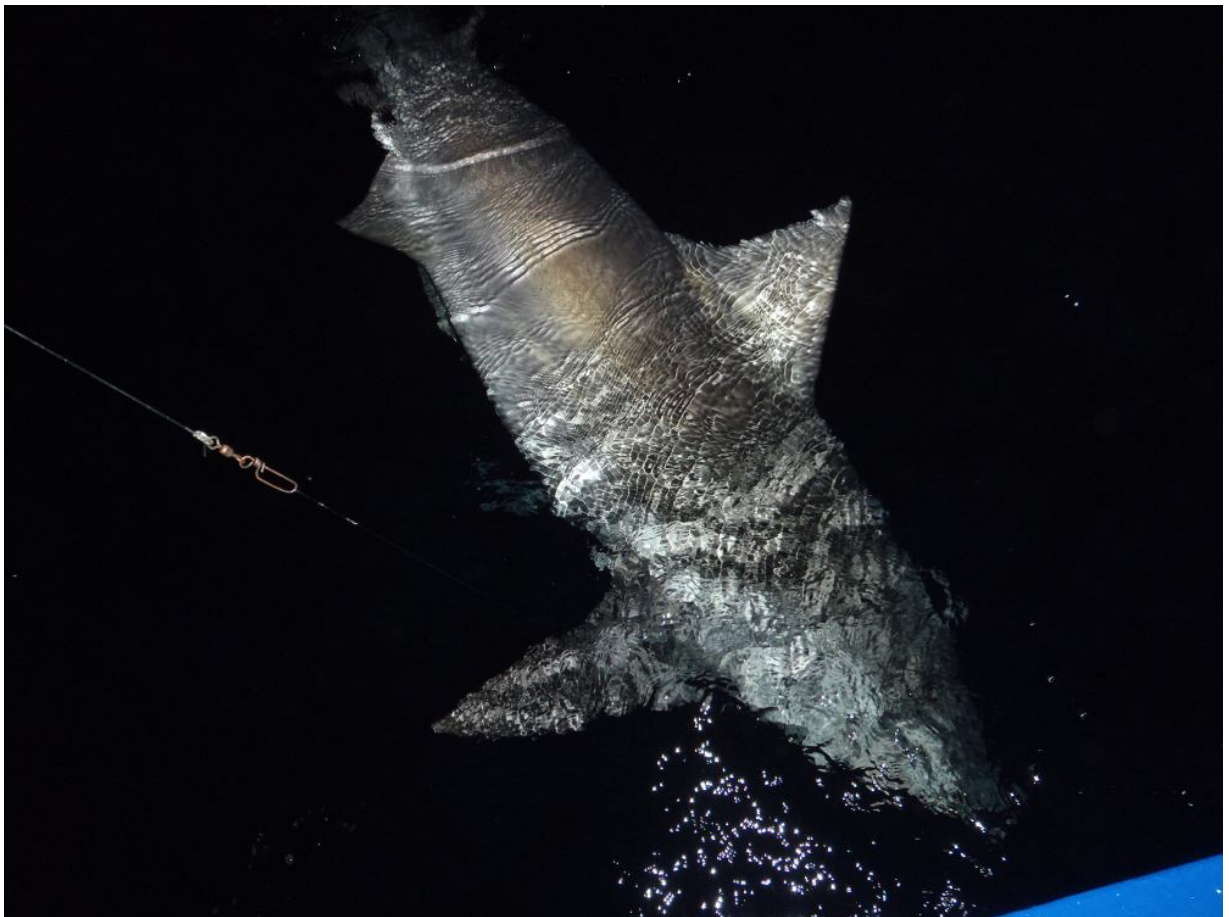
Geschützte Arten wie Hai und Rochen wurden alle released!