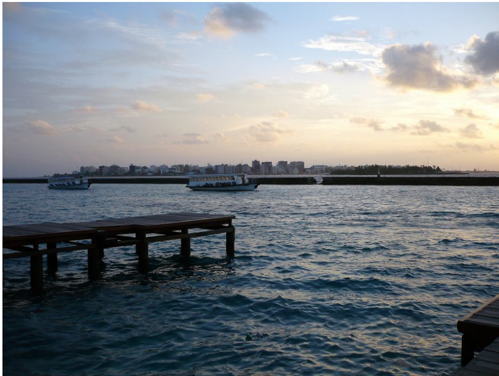
Ankunft, Blick vom Flughafen auf Male Stadt