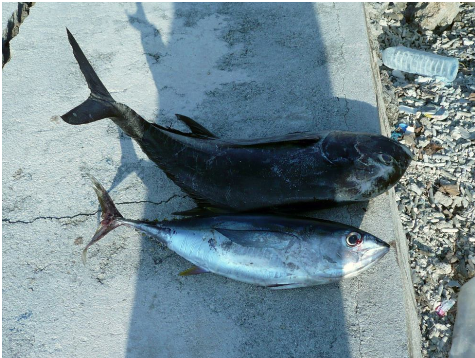
GT und Thun wurden beim Jiggen gefangen