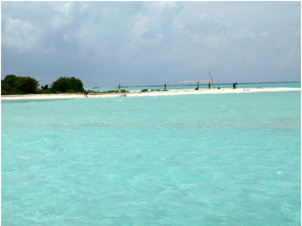
Tagesausflug zu einer einsamen unbewohnten Insel