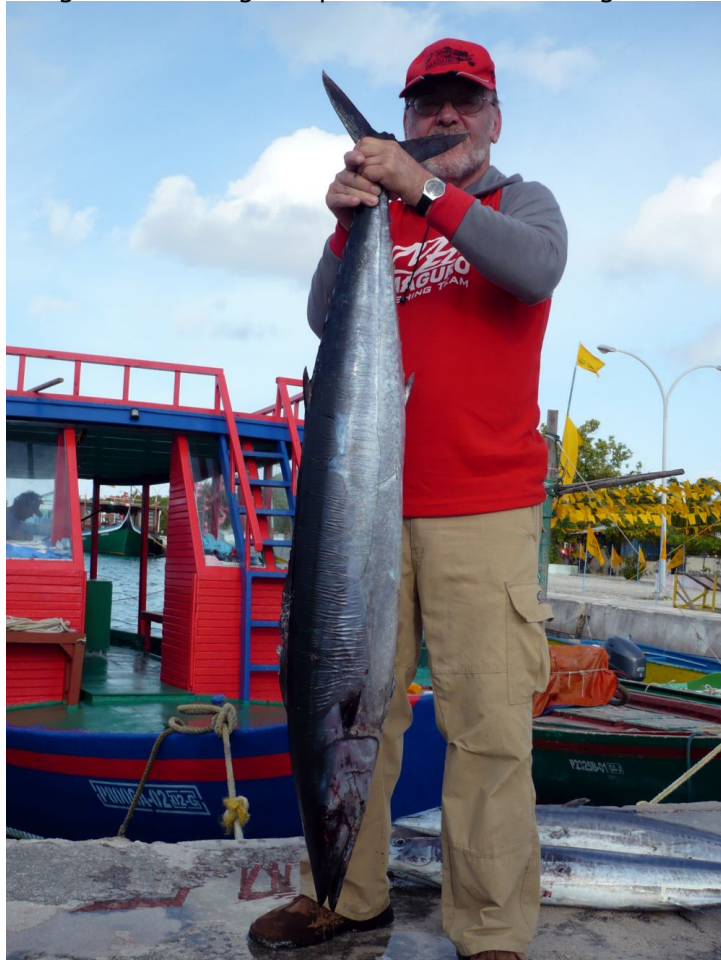
Strammer Wahoo unschlagbarer Köder war beim Trolling der Rapala Magnum rot/weiß in 18 und 22cm